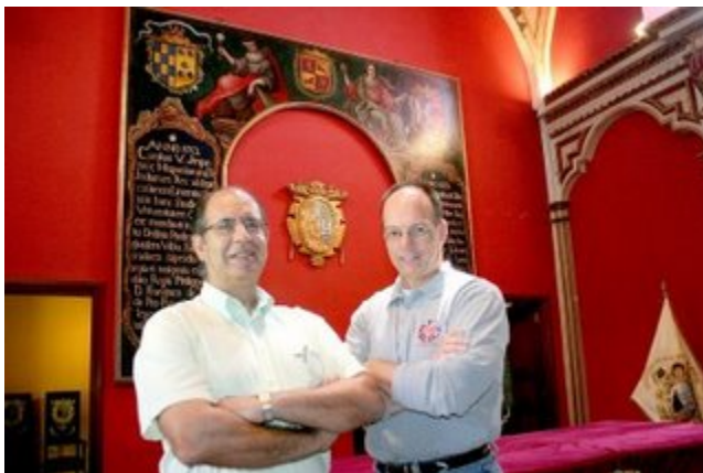
Aldo Berti realizó sus estudios de

El próximo paradigma asume una posición inédita en nuestros medios académicos: que las ideas se pueden crear, desarrollar e intercambiar de manera más profunda cuando la letra escrita se ve complementada con la música. De ahí que la presente edición viene acompañada de un disco compacto de canciones clásicas del activismo y la protesta, pero interpretadas por una generación de nuevos artistas. Cada capítulo del libro está vinculado directamente con la música, estimulando al lector a vivir la experiencia total de la palabra, el pensamiento y la música, la misma que produce una interacción más plena y actualizada con los conceptos que se abordan.